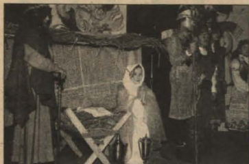
Dziecięcy zespół z Brzuchani