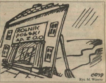
Rys. M. Wawro