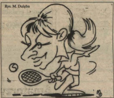
Rys. M. Dulbpa

Impreza potrwa do 14 lutego, a uczestniczyć w niej mogą zespoły osiedlowe, szkolne śródmiejscowe. Jedynym warunkiem jest ukończenie przez graczy 14 roku życia. Zgłoszenia przyjmowane są do najbliższego piątku w siedzibie WOKSiR w ul. p. 240, tel. 676-240 oraz w dziale sportowym „Echa Dnia”, ul. Targowa 18 (tel. 458-98).