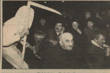
Dajcie groz dla śmierci