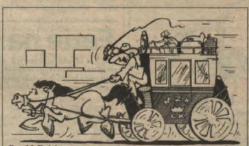
Rys. M. Dulęba