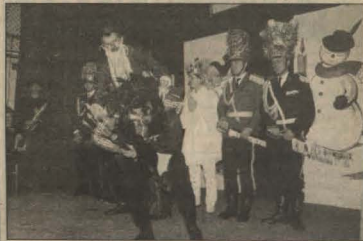
Zespół dorosłych z Brzuchani