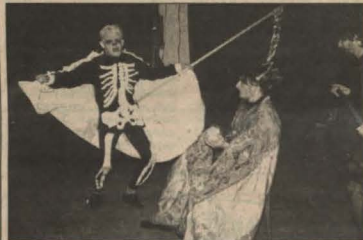
Kołędniczy ze Skalbierza