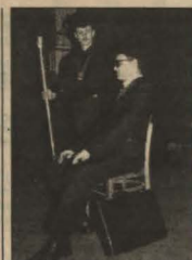
Nowoczesne herody z Wąchocka